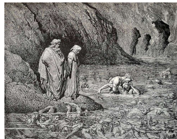
G. Doré – Inferno canto XXXII